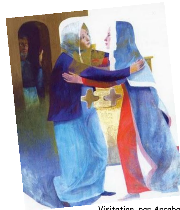
Visitation, par Arcabas

des personnes âgées ou jeunes, seules, malades, handicapées.